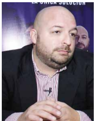
De Marco buscará tener algún compañero de banca a partir de fin de año.