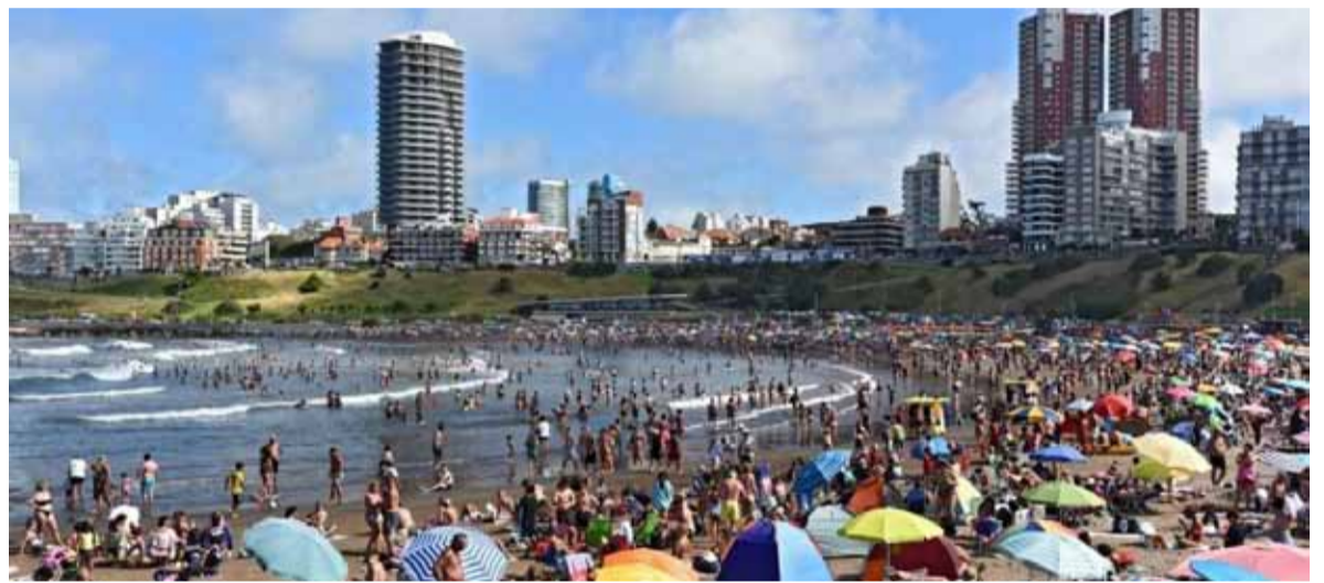
Verano 2025 en Mar del Plata.

En el sector extrahotelero sucede algo similar: “Están cumpliéndose las expectativas que veníamos teniendo, que después de Reyes iba a incrementarse el turismo. Estamos en un fin de semana que está superando el 70%”,