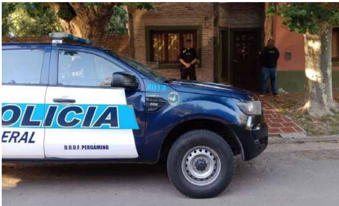
Detención en la localidad bonaerense de Mariano H. Alfonzo.

Se trata de una asociación ilícita dedicada a vaciar cuentas bancarias a través de un virus informático. Se logró individualizar a los once integrantes de la banda que en el país era liderada por un joven de 24 años de Mariano H. Alfonzo.