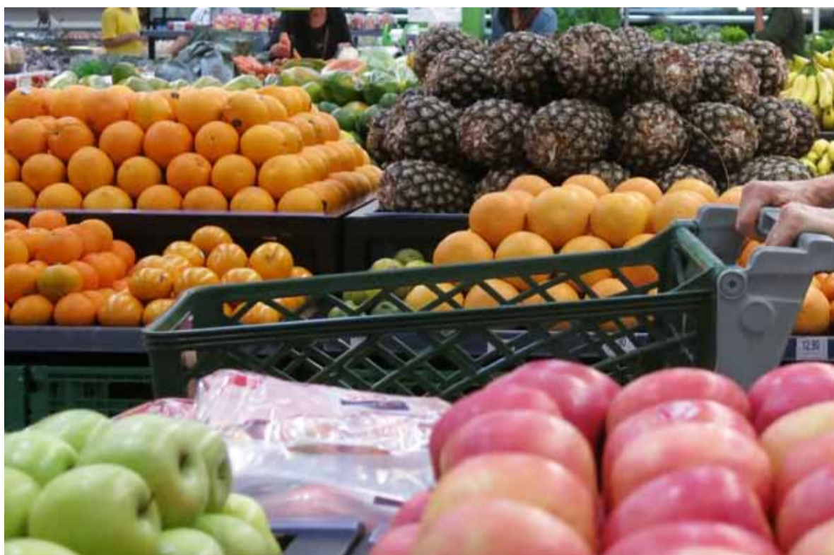
CAME: los precios de los agroalimentos.

Los precios se multiplicaron 3,9 veces del campo (origen) a la góndola (destino) en diciembre, según un informe de CAME. En promedio, la participación del productor explicó un 21% de los precios de venta final, un 11,4% menos con respecto al mes anterior.