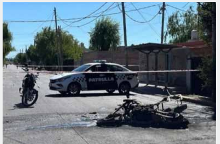
Dos policías muertos en una persecución en Quilmes. - Bomberos de Quilmes -

"El ruido fue tremendo, la moto quedó envuelta en llamas y la camioneta muy dañada. Fue un momento desesperante", relató una vecina que presenció el hecho, citada por TN. (DIB) GML