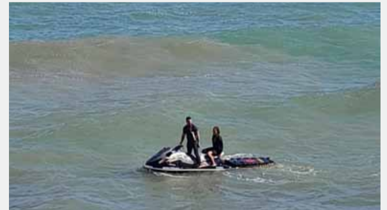
Buscan en Quequén a un turista desaparecido desde el viernes.

El operativo se amplió con la participación de brigadas de prevención, guardaparques, Defensa Civil y Guardavidas, quienes, junto a vehículos y motos acuáticas, realizan rastros en la zona. También se contó con la participación de un avión de la Prefectura que llegó desde la base de operaciones de Mar del Plata. (DIB) GML